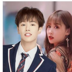
长按保存图片马上分享到朋友圈