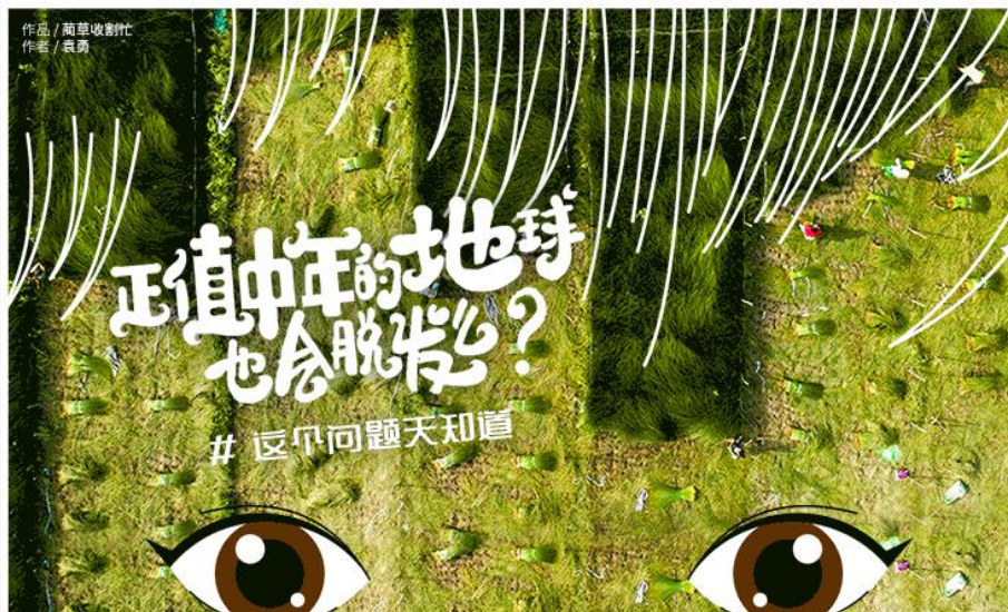
搜狐 | 瞰世界 第五届(2019)中国无人机影像大赛 50HU.COM THE 5TH (2019) INTERNATIONAL DRONE PHOTOGRAPHY CONTEST 7月23日-9月25日, 上天看看