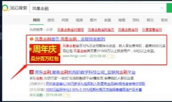
360搜索广告：关键词搜索

精准投放与高曝光融合，选择360关键词搜索广告和360优品展示广告这两个核心流量资源为裂变入口