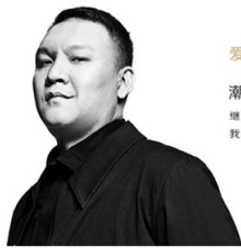
爱奇艺副总裁·车澈