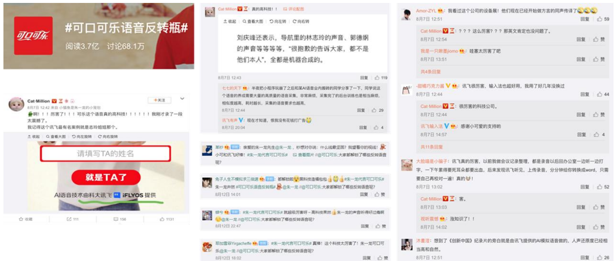
(吸引众多朱一龙、可口可乐年轻粉丝自发评论)

微博 KOL 发布 7 条，内容总阅读 3000W+，互动量 50000+；相关话题#可口可乐语音反转瓶# 阅读量达 3.7 亿+、讨论 70W+。其中朱一龙个人广告微博获得高达 27w 转发，58w 赞。可以说本次合作在粉圈收割到了今夏最高关注度。传播过程中，讯飞自媒体矩阵与可口可乐实现充分联动，引流效应显著。